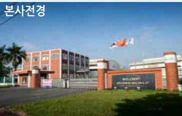
웰크론 호치민 사무소