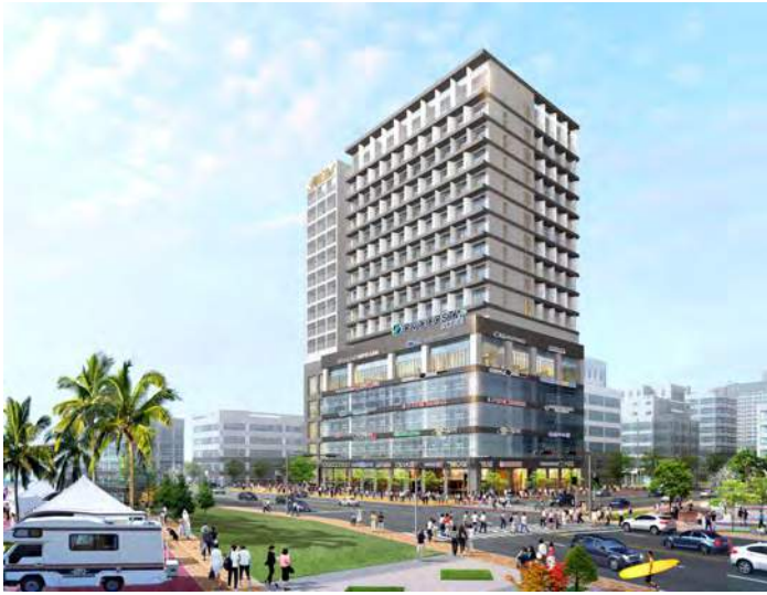
OVU COSTA (오뷰 코스타)