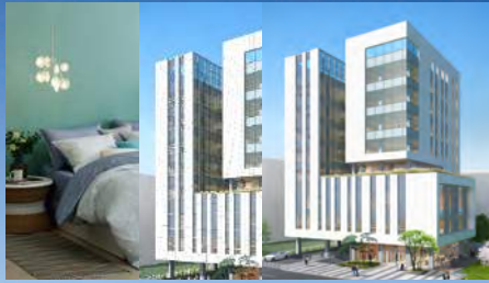
Total living & Lifecare