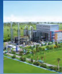
친환경 미래에너지 사업군