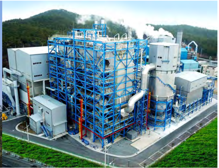
(주)대산파워 열공급시설 건설공사