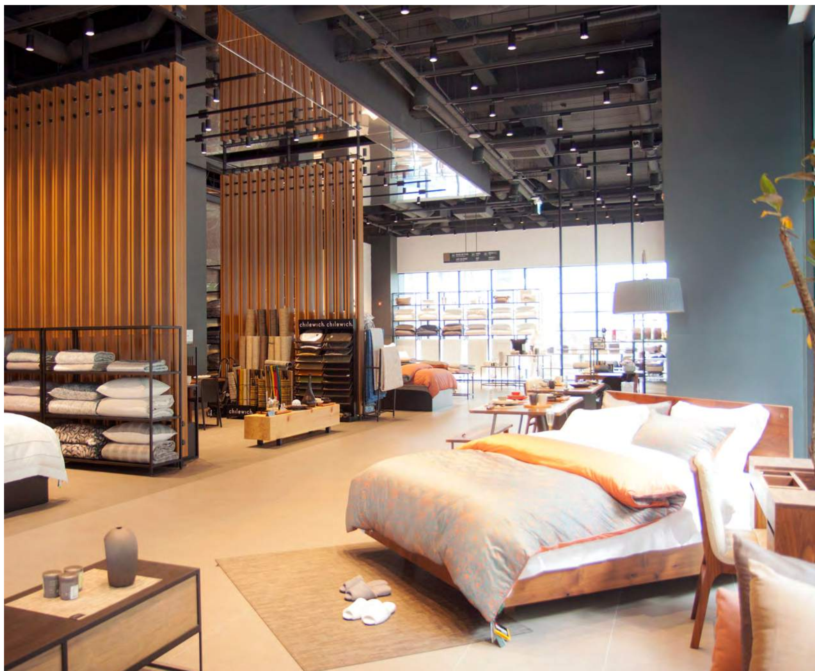
웰크론 플래그십 스토어 SESA EDITION