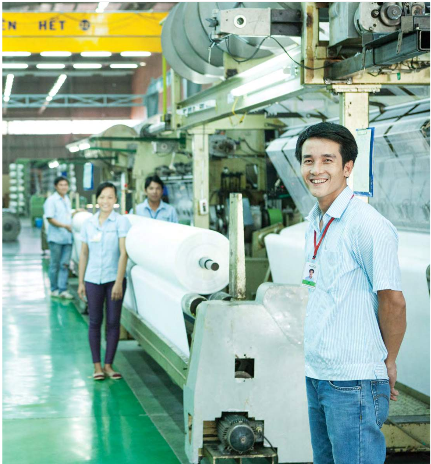
웰크론 글로벌비나 생산현장